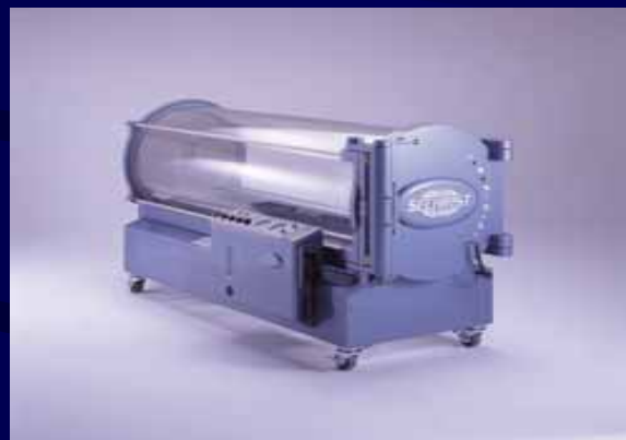
高気圧酸素 治療装置